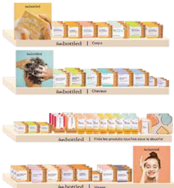
Maxi Best Of