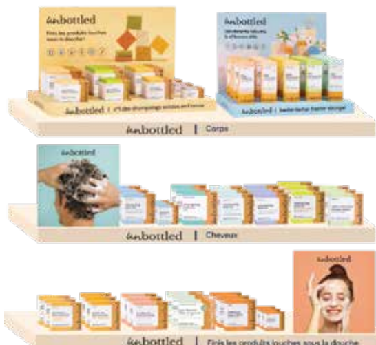
Best Of + PLV