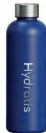
Gourde Hydratis Bleu 500ml