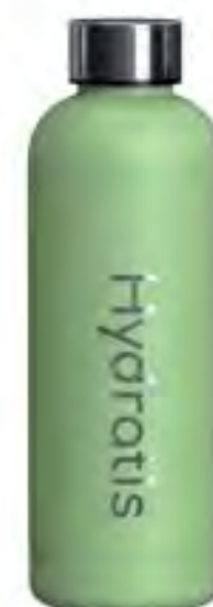
Gourde Hydratis Vert 500ml