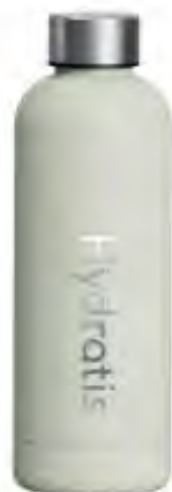
Gourde Hydratis Blanc 500ml