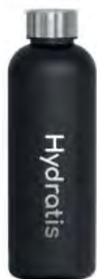
Gourde Hydratis Noir 500ml