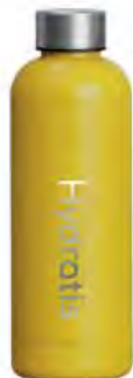
Gourde Hydratis Jaune 500ml