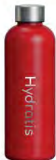
Gourde Hydratis Rouge 500ml